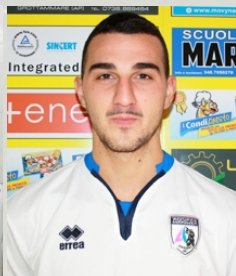
Corsi Oscar Centrocampista